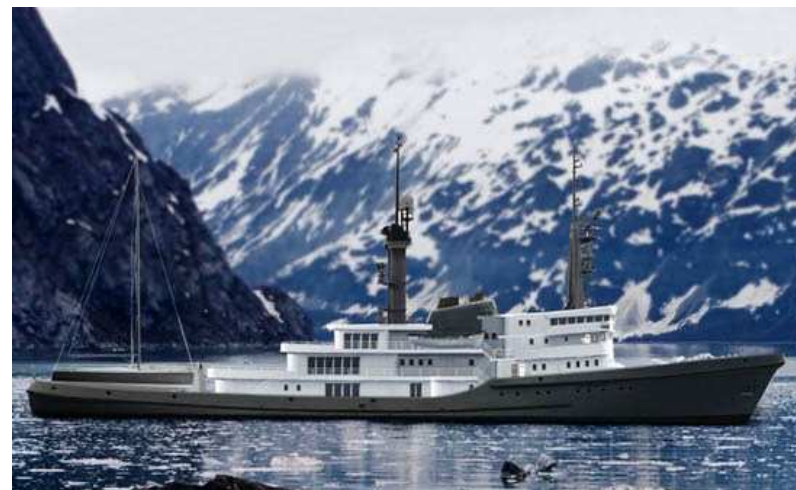
„Khozam“ (Umbauprojekt) Foto (~ 2013); 04.02.2015