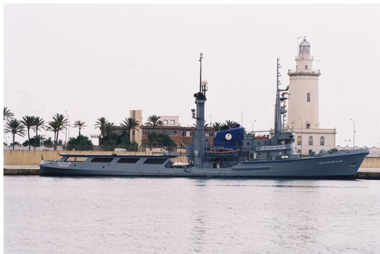
„Khozam“