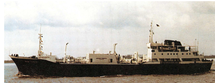
„ Anna Schulte “ Foto (1973): H. Brand KG, Oldenburg

Abmessungen: BRT: 1.599; NRT: 947; Tragfähigkeit: 2.555 t; L.ü.A.: 78,10 m; L.zw.d.L.: 70,40 m; Br.a.Spt.: 12,70 m; Tiefgang.: 6,18 m; S.-H.: 7,00 m (Hauptdeck) Tankinhalt: 2.420,0 m 3 LNG (100 %; - 162°C) Antriebsanlage: 1 MWM Dieselmotor, Viertakt, 8 Zylinder, einfachwirkend; Typ TBDG 500 8 U; Methan/Öl als Brennstoff; 1.766 kW (nur Öl)/ 1.112 kW (Methan/Öl); 500/ 437 U/min; 1 Propeller; 150/ 131 U/min; 13,0 kn 1.766 kW; 6,20 m Tfg.) Sondereinrichtungen: 1 Rückverflüssigungsanlage für Äthylen/LPG mit 3 Verflüssigungs- einheiten; 1 Inertgasanlage Kräne: - Ladebäume: 2 – 2,0 t Luken: - Tanks: 2 Doppelzylinder (Twin-Lobe); Werkstoff Aluminium; Auslegungst- emperatur -162°C bis + 45°C; max. 5,0 bar; spez. Gewicht der Ladung 0,42 – 0,9 t/m 3 ; Wärmedämmung 200 mm Polyurethan, mehrlagig mit Adeckung aus verzinktem Stahlblech. Konstruktion LGA Gastechnik GmbH, Remagen Besatzung: 17 Passagiere: - Schwesterschiffe: „Sophie Schulte“(Bau-Nr. 193); „Lissy Schulte“ (Bau-Nr. 194) ~ „Heriot“ (Bau-Nr. 189)