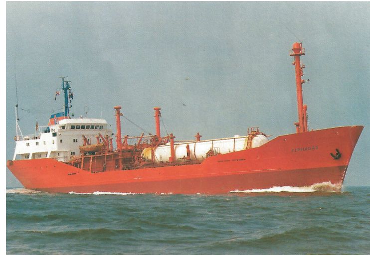
„Alphagas“ Foto (1970); „Neptun“, Bremen; Schiff und Hafen 1998, Nr. 04

1980 Compania Naviera de Cristobal S.A., Panama; c/o.: Sloman Neptun Schiffahrts- Aktiengesellschaft, Bremen; „Alicia 1“; Panama - Panama