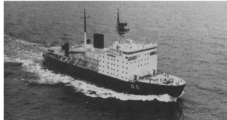
„Almirante Irizar“ Foto (12.1978): O/Y Wärtsilä A/B; Marine News 1979, Nr. 04)