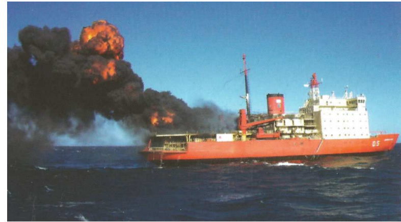
Die brennende „ Almirante Irizar “

2007 Am 10. April im Südatlantik auf 44.01 S 62.21 W (ca. 95 Sm südöstlich von Punta Delgada, Argentinien) nach einem im Hilfsdieselraum durch eine gebrochene Brennstoffleitung ausgelösten Brand manövrierunfähig und nach erfolgloser Brandbekämpfung von der Besatzung aufgegeben worden. Das Feuer konnte am 14. April von einer Bergungsmannschaft der argentinischen Marine gelöscht werden. Danach nach Puerto Belgrano, Argentinien, geschleppt. Anschließend mit schweren Schäden im Bereich des Maschinenraums und des Hubschrauberhangars aufgelegt.